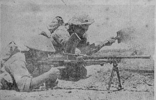
La infantería británica no pierde tiempo. Mientras que un soldado cava una trinchera, el otro ataca al enemigo en el desierto de Libia

Por su parte el señor Secretario de Agricultura en reporte de hace algunos días incluyó, de manera preferente para este año, la inversión de un millón de colones en el resurgimiento de la provincia de Limón. La aprobación, por parte del Congreso de la emisión de bonos da realidad a los deseos del Gobierno en beneficio nuestro. Si a todo esto agregamos que la facilidad de denunciar tierras en la milla marítima ensanchará nuestra agricultura, tendremos que con venir en que este año se presenta sonriente para la zona atlántica.