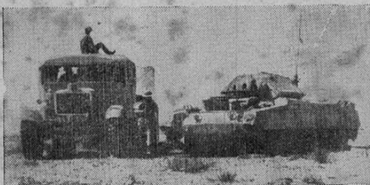
El eficiente servicio británico de reparación y transporte de tanques dañados en la batalla. Grandes camiones se encargan de retirar del campo de batalla a los tanques dañados.

LA VOZ ATLANTICA agradece la atención que la Dirección Nacional de Telégrafos y señor Gobernador dieron a la sugerencia de este semanario.