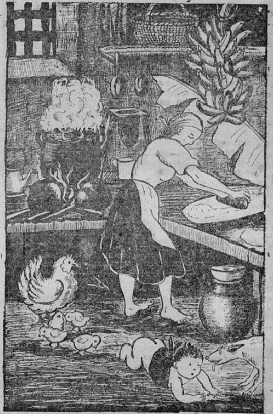
LA COCINA TIPICA COSTARRICENSE, DONDE SE SAZONAN LAS MAS EXQUISITAS VIANDAS

Entre los licores nacionales uno de los que cuenta con más aceptación es el RON CANERO, el fino ron popular para tomarlo puro o con agua mineral.