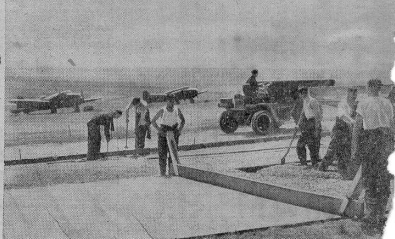
La R.A.F. cuenta con sus escuadrones de trabajo encargados de la reparación y conservación de los aeródromos británicos.