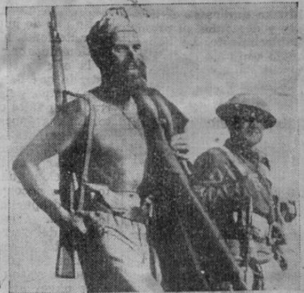
Los bravos soldados franceses de Bir Hacheim que tan preocuparon a Rommel

NO OLVIDE QUE LOS EXITOS COMERCIALES DEPENDEN DEL FUNCIONARIO.