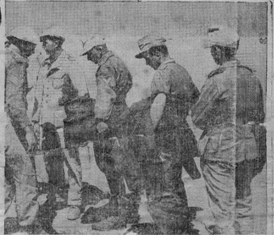
Más prisioneros alemanes llegan a las líneas inglesas en Libia