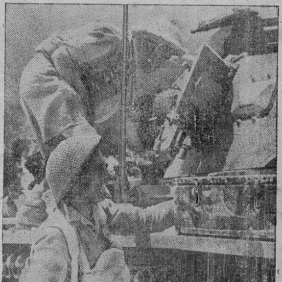
Otro tanque alemán que no volverá a molestar a los británicos en Libia, al ser inspeccionado por soldados del VIII Ejército.