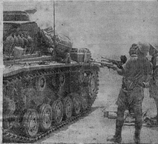
Un tanque alemán al ser capturado por los británicos en L...

Una gran 1942 oportunidad para adquirir los servicios competentes, de confianza y de muy larga experiencia.