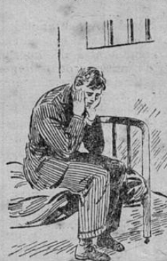
Se sentó en la cama de hierro y hundió la cabeza entre las manos. ...

Salió "sheriff" y Clyde se quedó desesperado. Miró a su alre-